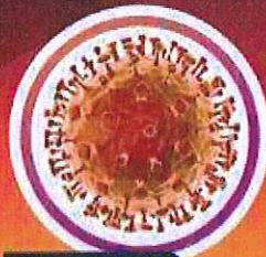
อันดับ 6 โรคนิปาห์ และเอนิปาไวรัส