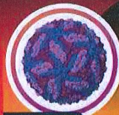
อันดับ 8 โรคซิก้า

โรคอุบัติใหม่ คือ โรคติดเชื้อชนิดใหม่ หรือเป็นเชื้อโรคเดิม ที่เรารู้จัก แต่เพิ่ง กลายพันธุ์จนมีความ รุนแรงมากขึ้น หรือ เชื้อโรคที่เรารู้จัก แต่เพิ่งแพร่กระจาย ระบายนึงพื้นที่ใหม่ ประเทศใหม่ หรือ ในกลุ่มประชากรใหม่