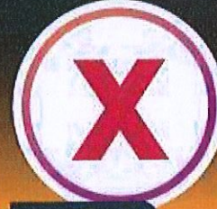
อันดับ 9 โรค X (สำหรับเชื้อโรค ที่ไม่รู้จัก ซึ่งอาจ ทำให้เกิดการ ระบาดในอนาคต)