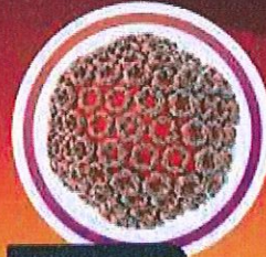
อันดับ 7 ไข้ Rift Valley

โรคอุบัติใหม่ คือ โรคติดเชื้อชนิดใหม่ หรือเป็นเชื้อโรคเดิม ที่เรารู้จัก แต่เพิ่ง กลายพันธุ์จนมีความ รุนแรงมากขึ้น หรือ เชื้อโรคที่เรารู้จัก แต่เพิ่งแพร่กระจาย ระบายนึงพื้นที่ใหม่ ประเทศใหม่ หรือ ในกลุ่มประชากรใหม่