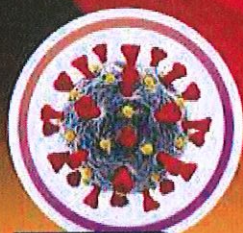
อันดับ 1 โควิด-19

อาจก่อให้เกิดภาวะฉุกเฉินทางสาธารณสุข ปัจจุบันยังไม่มีมาตรการป้องกันหรือการรักษาที่เพียงพอ