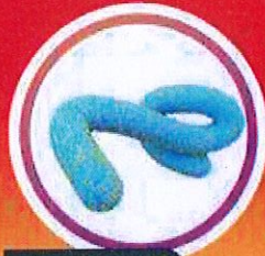
อันดับ 3 โรคไวรัสอีโบลา และโรคไวรัส มาร์บวร์ก