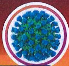
อันดับ 5 ไวรัสโคโรนา กลุ่มอาการ ทางเดินหายใจ ตะวันออกกลาง (MERS-CoV) และโรคเกี่ยวกับ ทางเดินหายใจ เฉียบพลัน รุนแรง (SARS)